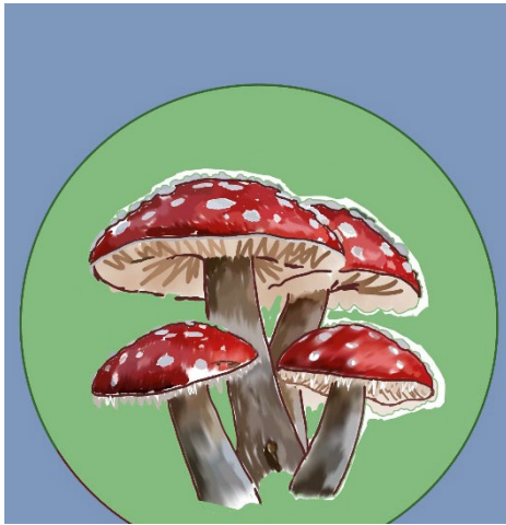
Abbildung 1: Glückspilz als Bezeichnung für den Fliegenpilz