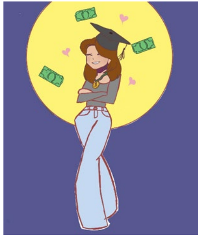
Abbildung 2: Glückspilz als Personenbezeichnung